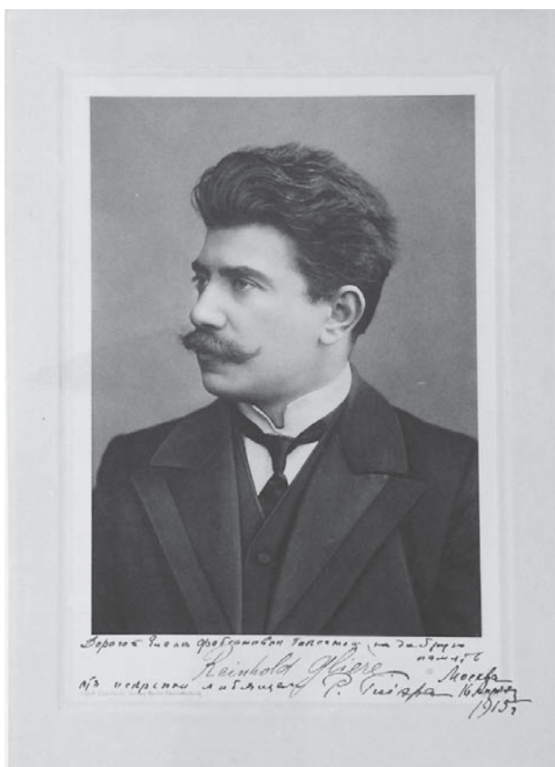
Р.М. Глиэр. 1915.

С дарственной надписью к Ел. Ф. Гнесиной