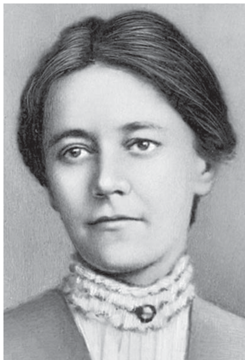
Евгения Эдуардовна Линева

в разработке методов обучения народно-певческому искусству сыграла русская певица, педагог, собирательница, исследовательница и пропагандист народной музыки Евгения Эдуардовна Линева.