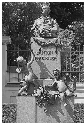
Илл. 6. Старейший памятник Брукнеру в г. Штайр

Завершая сказанное, можно с уверенностью сказать, что Брукнер был бы счастлив увидеть такое признание, которое он не испытал при жизни. Как известно, творческая удача и известность зависят не только от таланта и личностных качеств, но и в большой мере от общества, которое принимает наследие композитора, отрицает его или остается равнодушным. Калейдоскоп концертных мероприятий, не прекращающийся по сей день, заряжает любовью к музыке Брукнера и порождает стремление к открытию новых граней интровертной личности!