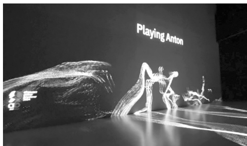
Илл. 2. Инсталляция «Планета Антон» 7