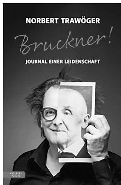
Илл. 5. "Bruckner! Journal einer Leidenschaft"