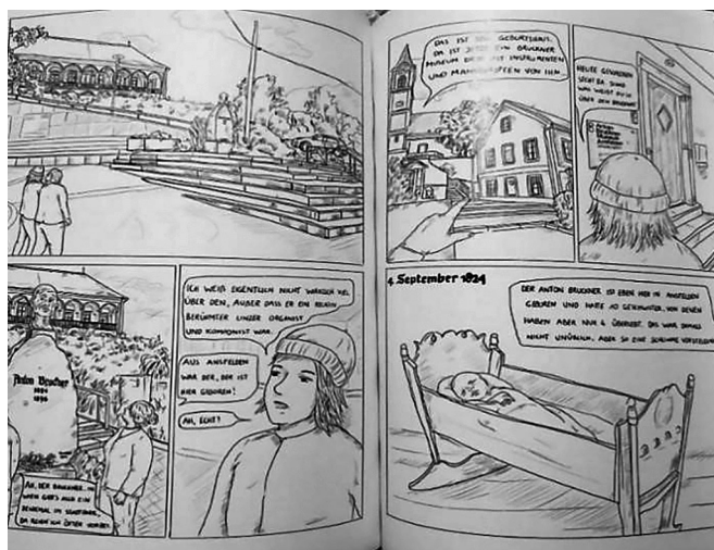
Илл. 5. "Ein Spaziergang in Bruckners Vergangenheit von Sarah Braid" (с. 4–5)

Pic. 5. "A Walk in Bruckner's Past by Sarah Braid" (p. 4–5)