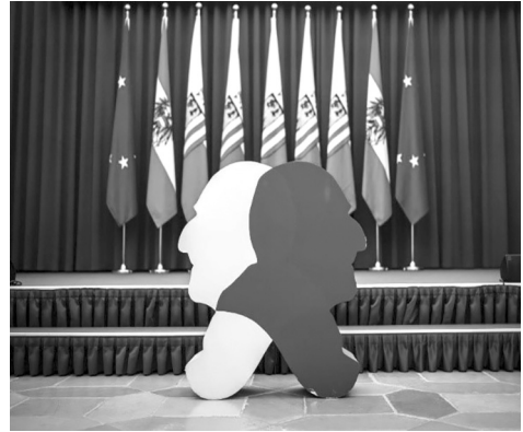
Илл. 1. Логотип юбилейного года А. Брукнера

В рамках детского проекта “Bruc.Kinder.Spiel” («Брук.Дети.Игра») детям предложили нарисовать картины под впечатлением звучащей музыки Брукне-