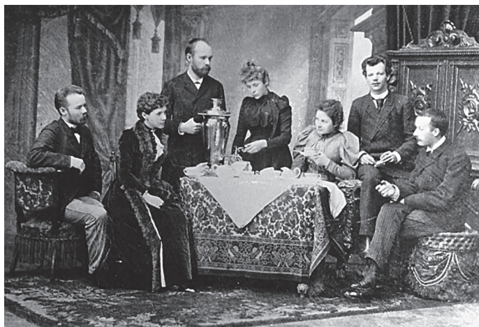
Илл. 1. Братья и сестры Конюс