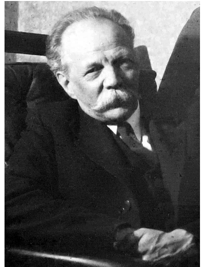
Илл. 5. Лев Конюс